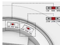
Farbtemperatur an Leuchte einstellbar (2700K/3000K/4000K) Leistung an Leuchte einstellbar (15W/20W/25W)